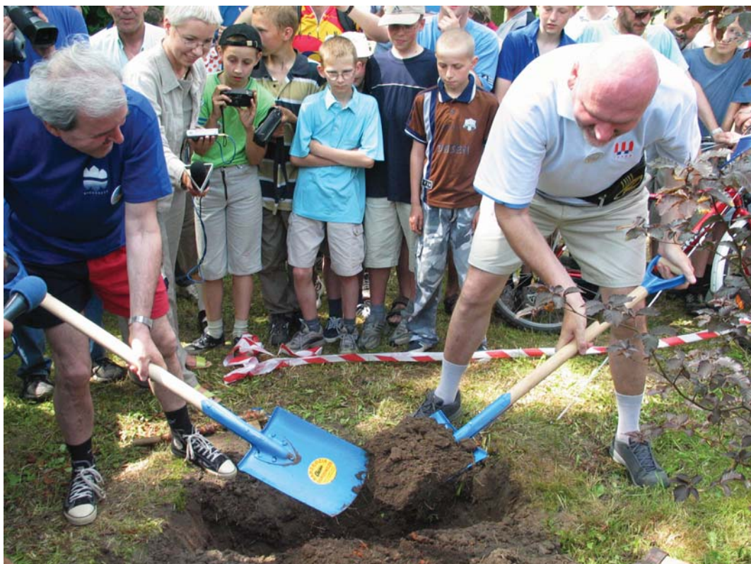
"Topór wojenny zakopany" - Prezydenci Bydgoszczy i Torunia.