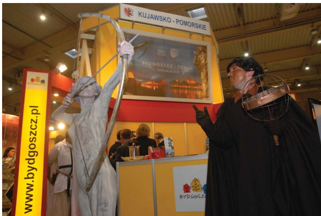
Łuczniczka i Kopernik - symbole miast. Wspólna promocja na Międzynarodowych Targach Turystyki w Poznaniu.

organizowane są warsztaty będące okazją do wymiany doświadczeń, podzielenia się umiejętnościami. Znaczenie Festiwalu dostrzegło Ministerstwo Kultury i Dziedzictwa Narodowego przyznając dofinansowanie jego kolejnej edycji.