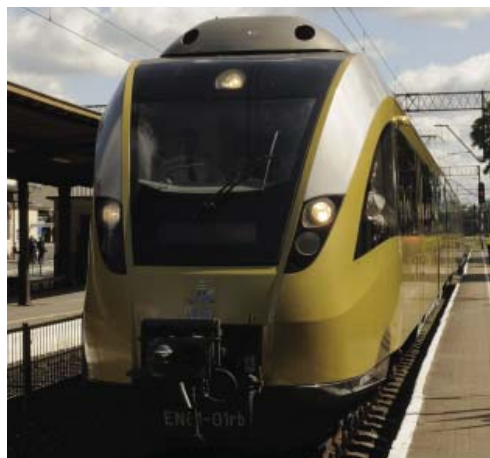
BiT-City szybka kolej metropolitalna.

Osnową dla szybkiej kolei ma być istniejąca linia kolejowa łącząca Bydgoszcz z Toruniem. Intermodalność zaś będzie polegała na powiązaniu kolei z transportem szynowym i autobusowym oraz powstanie miejsc przesiadkowych, tzw. zintegrowanych węzłów transportowych, które mają minimalizować liczbę i czas przesiadek. Tym samym umożliwią bezkolizyjne zmiany środka transportu z pociągu na tramwaj, autobus, a w konsekwencji dotarcie do bydgoskiego portu lotniczego. Efektami zaplanowanej inwestycji będą: skrócenie czasu podróży między głównymi miastami województwa z obecnych 64 min. (średnia prędkość komunikacyjna 50 km/h) do 37min. (średnia prędkość komunikacyjna 86 km/h), wzrost liczby podróżujących komunikacją zbiorową w obszarze BTOM z 503,07 tys. na dobę w roku 2007 do 638,15 tys. na dobę dla prognozowanego roku 2015, większa dostępność mieszkańców regionu do lokalnych oraz międzynarodowych połączeń lotniczych.