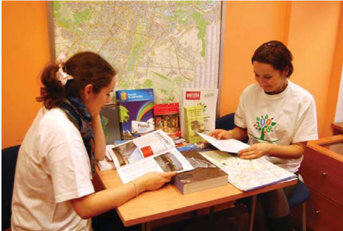
Wolontariuszki obsługujące konferencję klimatyczną.

obecny stan wolontariatu w Wielkopolsce oraz potencjalne przyszłe kierunki jego rozwoju. Dzięki przeszkoleniu wolontariuszy, dobrze przygotowanych, by aktywnie włączać się w inicjatywy społeczne i miejskie (jak chociażby obsługa imprez sportowych, m.in. Euro 2012), wolontariat zyska nową jakość.