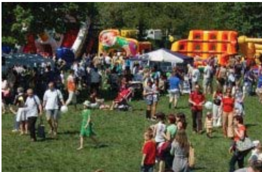
Piknik rodzinny na Wrocławskim Torze Wyścigów Konnych w ramach kampanii „Zdrowa rodzina - fajna sprawa”.

Z inicjatywy młodych ludzi powstał wolontariat dla Armii Krajowej. To ostatni dzwonek, aby pokazać żywą historię czasów II wojny światowej. Projekt „historii mówionej” przybliży losy żołnierzy, wówczas młodych przecież ludzi, którzy zamiast cieszyć się młodością, walczyli